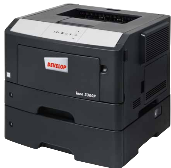
ineo 3300P mit zusätzlicher 550 Blatt-Papierkassette (PF-P12)

Ist Ihr derzeitiges Drucksystem unübersichtlich und schwer zu bedienen? Dann steigen Sie um auf die ineo 3300P. Der Bedienkomfort wird Sie und Ihr Team sofort positiv beeindrucken und es bleibt mehr Zeit für die wichtigen Kernaufgaben. Und bei der ineo 3300P brauchen Sie kein umfangreiches Bedienungshandbuch zu fürchten: sie lässt sich intuitiv bedienen.